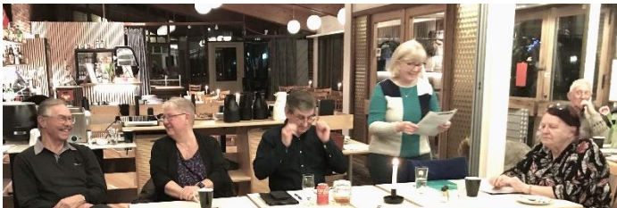
Generalforsamling med indledende fælles spising Februar 24

EN AKTIV FORENING MED GOD OPBAKNING. NÅEDE DU AT VÆRE MED? ellers KAN DU BARE VÆRE MED FREMOVER!