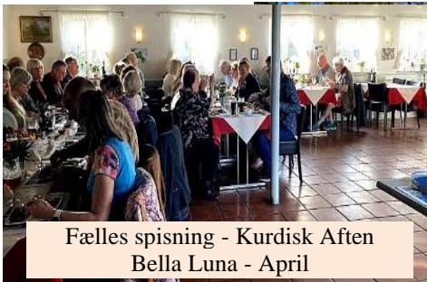
Fælles spising - Kurdisk Aften Bella Luna - April

Aftale om brugsret på Are- alet ved Nyvej / Tangvej April 24