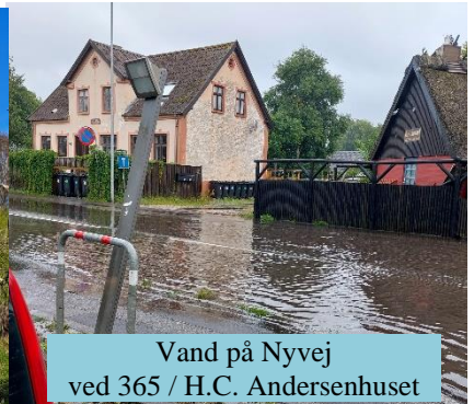
Vand på Nyvej ved 365 / H.C. Andersenhuset