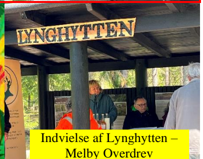
Indvielse af Lynghytten – Melby Overdrev

Aftale om brugsret på Are- alet ved Nyvej / Tangvej April 24